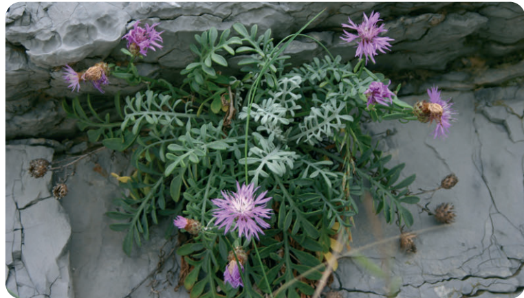
Fiordaliso di Porto Venere (endemismo presente nell'Area Protetta)

4 Variante n°4: Canalone -scorciatoia dal C.E.A. al Terrizzo- Si scende la scalinata che conduce alla "Casa dell'Ammiraglio" riconoscibile dalla presenza di un pino domestico monumentale, si segue la strada e dopo un paio di tornanti, si prende il sentiero sulla sinistra che inoltrandosi nella zona più umida della Palmaria permette, in circa 20 minuti, di giungere al Terrizzo.