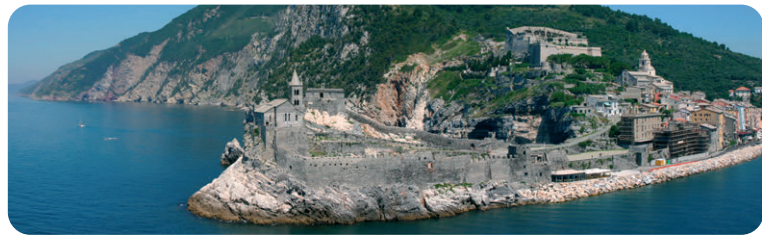
Veduta del promontorio dell'Arpaia dal Periplo dell'Isola Palmaria

1 Variante 1: Poco prima che il sentiero si inoltri nella lecceta un bivio in salita conduce attraverso le dodici stazioni della via Crucis alla "Croce del Giubileo", di notte visibile dalla strada che congiunge La Spezia a Porto Venere perché illuminata. Proseguendo il sentiero in salita sulla destra si percorre l'Alta Via del Golfo (AVG) verso La Spezia invece proseguendo sullo sterrato si giunge a sella Derbi ricollegandosi al sentiero n. 1.